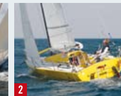
2 PLUTO, MINI 6.5 PROTO Karl Otto Book, Åsgårdstrand Seilforening