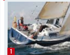
1 BLÅ, X-332 Øyvind M. Vedeler, Kongelig Norsk Seilforening