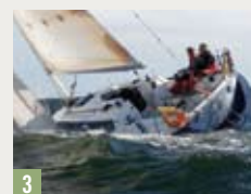
MY WAY, Hanse 370e Stein Thoresen, Bærum Andreas Abildgaard, KNS